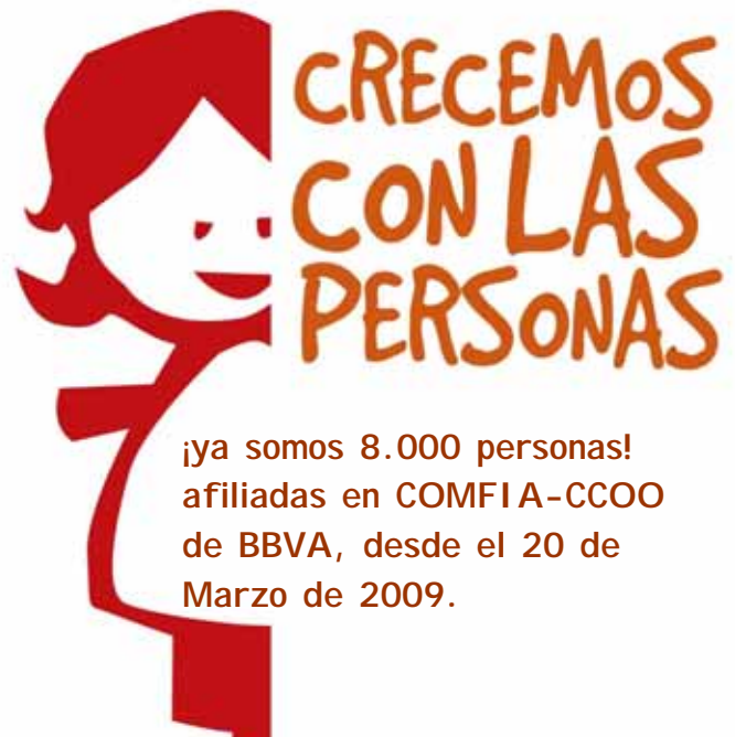
Representación sindical en BBVA