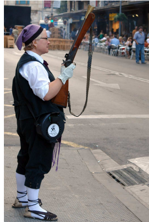
Jefe de Zona