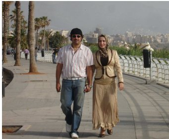
Mujer y hombre con jersey