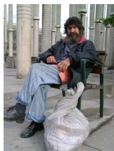
Gestor de proximidad