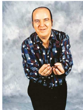
Home amb vestit però amb camisa sense corbata