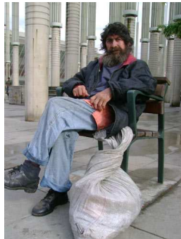
Gestor de proximitat