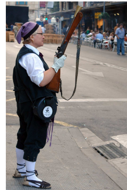
Cap de Zona

Entre els complements i la vestimenta més adequada es trobaria: penjolls i joies ostentoses, corbates o indumentària infantil, pírcings i tatuatges visibles, insígnies, auriculars, excés de maquillatge i laques i gomines, gorres i mocadors de cap, roba i calçat esportiu, roba excessivament cenyida o transparent, escots o obertures pronunciades, samarretes amb eslògans i missatges publicitaris. A qui no li mola veure el tanga mig per fora?? En endavant Auditoria farà uns controls exhaustius i personalitzats per tal de vetllar que som l'entitat més chachi guai Piruli.