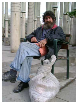
Gestor de proximitat