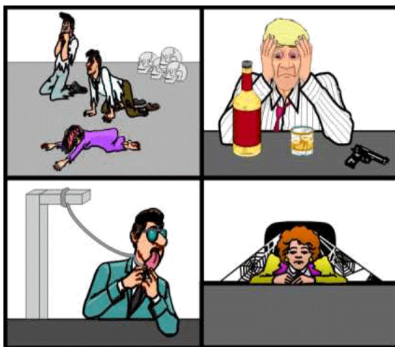
Molts empleats van poder assistir als diversos monòlegs del "Club de la Comèdia"

Resum de la gran festa final del club de la comèdia, amb dos mil convidats, plató televisiu en directe, entrevistes, sopar de fantasia, repartiment de premis, obsequis per a tots els assistents, i showman inclòs per amenitzar la vetllada. Es van otorgar els següents premis: al millor president, al millor director general i al millor encarregat de trasllat de serveis centrals. L'únic que va quedar desert va ser el de millor instal·lador de calefacció.