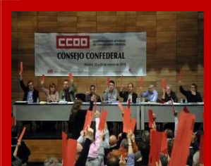
Resolución III Congreso COMFIA ante la crisis 21/04/2009

Tus datos serán incorporados a un fichero titularidad de CCOO integrado por los ficheros pertenecientes a la confederación o unión regional correspondiente según el lugar en que radique tu centro de trabajo, a la federación del sector al que pertenezca la empresa en la que trabajes, así como - en todo caso - a la CSCO. En siguiente URL puedes consultar los diferentes entes que componen CCOO: http://www.ccoo.es/sindicato/sindicato.html . La finalidad del tratamiento de tus datos por parte de todas ellas la constituye el mantenimiento de tu relación como afiliado, con las concretas finalidades establecidas en los estatutos. Además de lo indicado tus datos pueden ser empleados por CCOO para remitirte información sobre las actividades y acuerdos de colaboración que se establezcan con otras entidades. Siempre estarás informado en la web de CSCO ( http://www.ccoo.es ) de dichos acuerdos y de los datos de dichas entidades. Puedes ejercitar tus derechos de acceso, rectificación, cancelación y, en su caso, oposición, enviando una solicitud por escrito acompañada de la fotocopia de tu D.N.I. dirigida a CSCO con domicilio sito en la C/ Fernández de la Hoz nº 12. 28010. Madrid. Deberá indicar siempre la referencia "PROTECCIÓN DE DATOS". Si tienes alguna duda al respecto puedes remitir un email a lodp@cco.es o llamar por teléfono al 917028077.