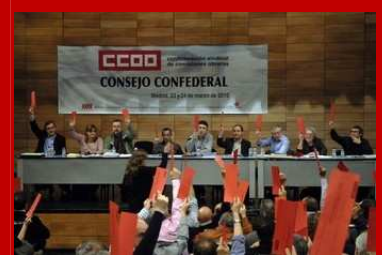
Extracto del Informe general aprobado por el Consejo Confederal de CCOO el 24/03/2010