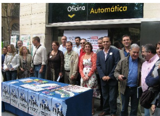
Mesa instalada por CCOO Cajasol en Villasis

Desde la óptica de la RSE, CCOO Cajasol actúa tanto en la faceta interna de nuestra Caja como en nuestra faceta de agentes sociales externos, a fin de que se den condiciones laborales decentes.